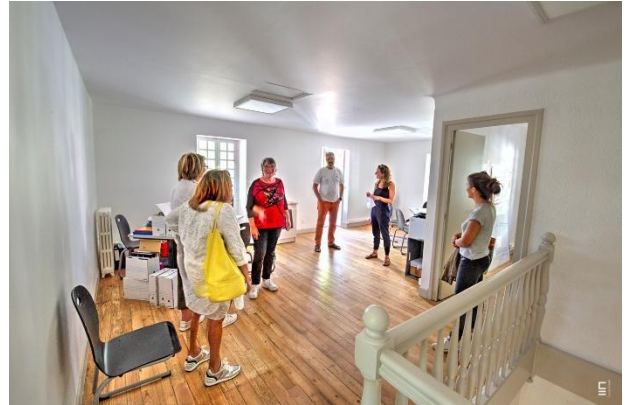
Espace de travail

L'association projette la mise en place d'un jardin en permaculture sur le terrain de la Maison, en partenariat avec l'entreprise Terre Permaculture basée à Biarritz. Stratégiquement placée au cœur du parc Mazon, le projet se veut collectif en associant les acteurs du quartier. Véritable outil pédagogique, des ateliers seront mis en place avec les structures citées précédemment pour faire vivre ce jardin et former à la permaculture. Un dossier a été déposé au budget participatif du département pour le financement du projet en accord avec la Mairie de Biarritz.