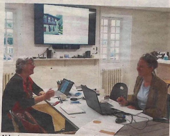
Aide et accompagnement pour les porteurs de projets, formations, expositions ou conférences sont au menu.