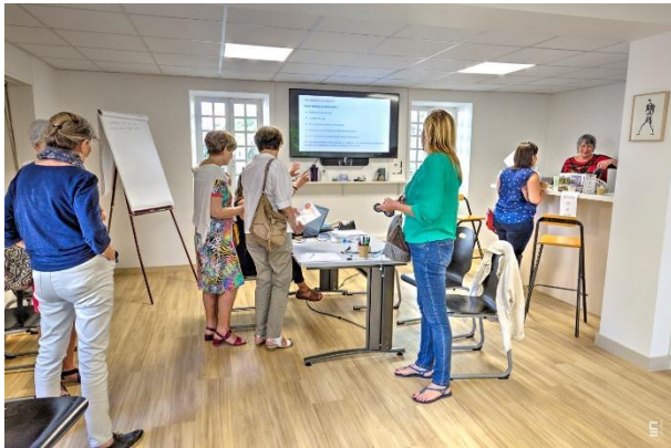
Salle de conférence

Au cœur de Biarritz, une maison sur deux niveaux : au rez de chaussée, une salle pouvant accueillir une cinquantaine de personnes pour les conférences, les visio-conférences et les formations, un couloir de présentation des projets et d'expositions, une bibliothèque ciblée... A l'étage, un espace de travail permettant l'émergence et le soutien logistique de projets.