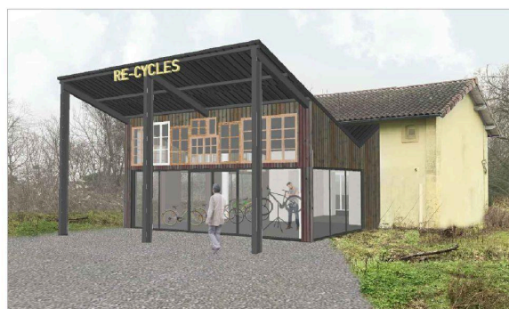
VUE DE L'ENTREE