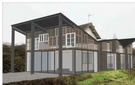
VUE DE L'ARRIERE DU PROJET